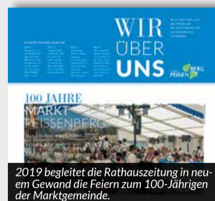
2019 begleitet die Rathauszeitung in neuem Gewand die Feiern zum 100-Jährigen der Marktgemeinde.

Mit welchen Projekten hat das Rathaus zu tun? Welche Initiativen gibt es? Auf welche Verordnungen und Maßnahmen möchte oder muss die Behörde aufmerksam machen?