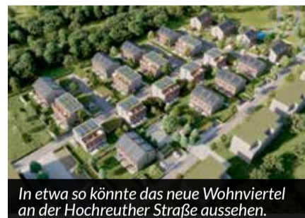
In etwa so könnte das neue Wohnviertel an der Hochreuther Straße aussehen.

D ie neue Wohnsiedlung an der Hochreuther Straße beinhaltet ein durchgängiges Gestaltungskonzept der Architektur und Außenanlagen. Dazu gehören Fuß- und Radwege, Car- und Bikesharing und naheliegende Versorgungseinrichtungen. An soziale Begegnungsflächen für nachbarschaftliche Netzwerke und einen Kinderspielplatz ist ebenso gedacht.