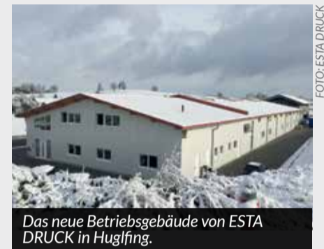
Das neue Betriebsgebäude von ESTA DRUCK in Huglfing.

Die Huglfinger Firma druckt ‚wir über uns‘ von Beginn an. Und auch andere Produkte der Marktgemeinde übernimmt sie seit Langem mit kompetenter Beratung und technischer Erfahrung.