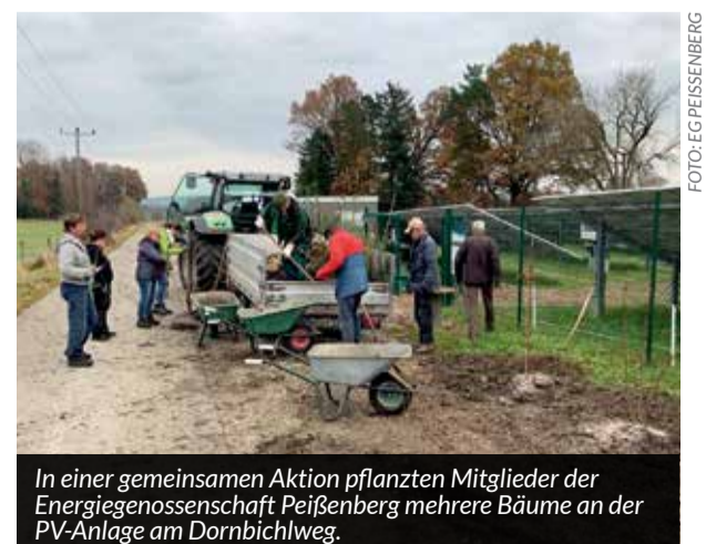
In einer gemeinsamen Aktion pflanzten Mitglieder der Energiegenossenschaft Peißenberg mehrere Bäume an der PV-Anlage am Dornbühlweg.

Bei Interesse könnten damit gleichzeitig eine Lademöglichkeit für E-Autos (Wallbox) oder Batteriespeicher installiert werden. Wer eventuell eine Freifläche kennt oder überlegt, sich der Sammelbestellung anzuschließen, kann sich unverbindlich an die Energiegenossenschaft wenden: info@eg-peissenberg.de .