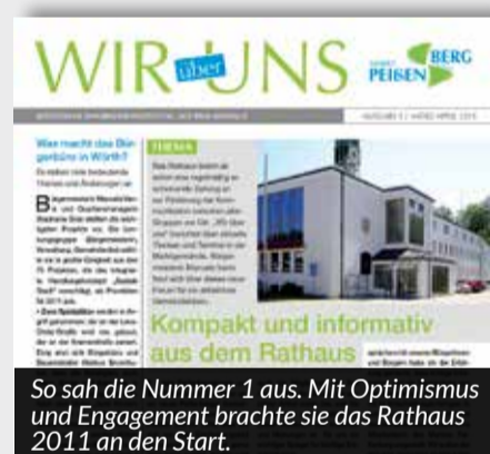
So sah die Nummer 1 aus. Mit Optimismus und Engagement brachte sie das Rathaus 2011 an den Start.