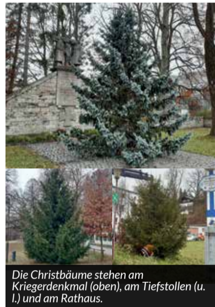
Die Christbäume stehen am Kriegerdenkmal (oben), am Tiefstollen (u. l.) und am Rathaus.

D er Markt Peißenberg möchte sich auch dieses Jahr wieder bei den Spendern bedanken, die mit ihren Christbäumen zu einer festlichen Stimmung in der Gemeinde wesentlich beitragen.