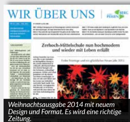
Weihnachtsausgabe 2014 mit neuem Design und Format. Es wird eine richtige Zeitung.