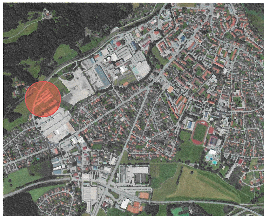
Ausschnitt Luftbild unmaßstäblich