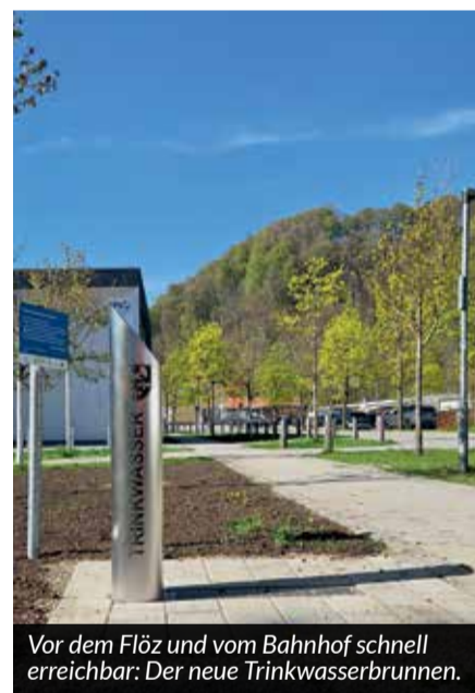
Vor dem Flöz und vom Bahnhof schnell erreichbar: Der neue Trinkwasserbrunnen.

Der Markt Peißenberg wünscht allen angenehme Erfrischung in der warmen Jahreszeit.