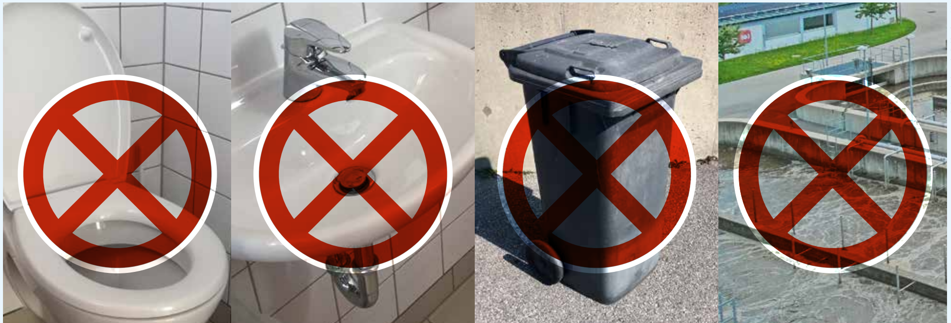
Viele Einwohner in Peißenberg wissen nicht, wie sie ihre Medikamente entsorgen sollen und kippen diese dann einfach in die Toilette, in den Ausguss oder in die Restmülltonne. Doch das ist verboten!

Für weitere Informationen besuchen Sie die Webseite www.arzneimittelentsorgung.de .