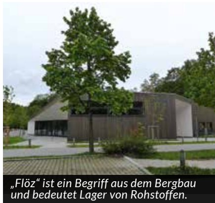
„Flöz“ ist ein Begriff aus dem Bergbau und bedeutet Lager von Rohstoffen.