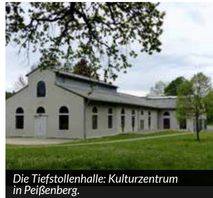
Die Tiefstollenhalle: Kulturzentrum in Peißenberg.

Bereits gekaufte Karten werden automatisch zurückerstattet, wenn sie online gekauft wurden. Andernfalls bitte die Karten mit Ihrer Kontonummer und Anschrift senden an: Büro Kulturverein, B. Hampp, Hauptstraße 77, 82380 Peißenberg.