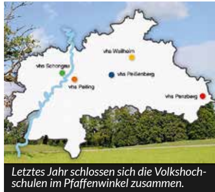
Letztes Jahr schlossen sich die Volkshochschulen im Pfaffenwinkel zusammen.