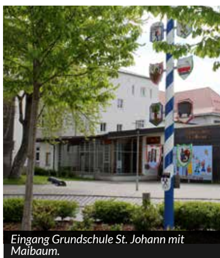
Eingang Grundschule St. Johann mit Maibaum.

15 Euro kostet der Jahresbeitrag. Beitrittsformulare gibt es im Sekretariat der Grundschule St. Johann, Schulweg 2, oder auf der Homepage www.gs-st-johann.de .