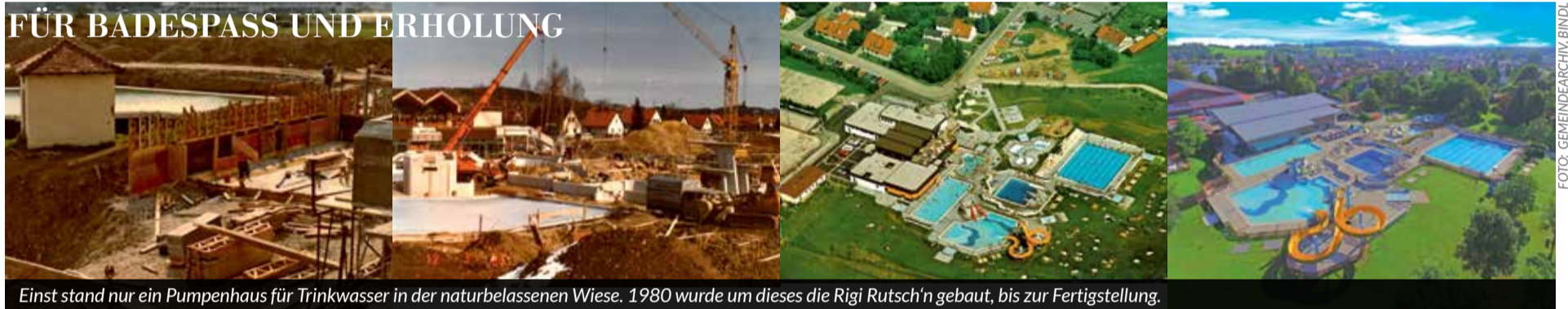
Einst stand nur ein Pumpenhaus für Trinkwasser in der naturbelassenen Wiese. 1980 wurde um dieses die Rigi Rutsch'n gebaut, bis zur Fertigstellung.

DER MARKT PEIßENBERG UND DIE GEMEINDEWERKE PEIßENBERG SORGEN SEITDEM FÜR BADESPASS UND ERHOLUNG