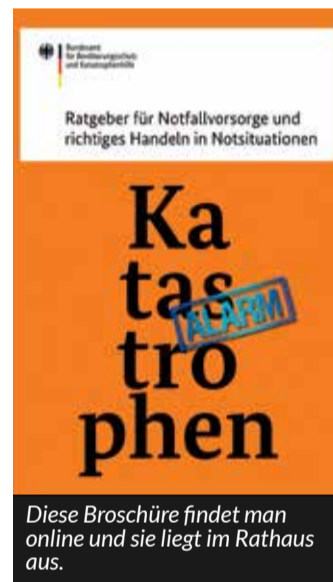
Diese Broschüre findet man online und sie liegt im Rathaus aus.

Anstöße dazu, welche Dinge dann gebraucht werden, erhalten Sie beim Bundesamt für Bevölkerungsschutz https://www.bbbk.bund.de/ oder mit der kostenlosen Broschüre, die im Foyer des Rathauses ausliegt.