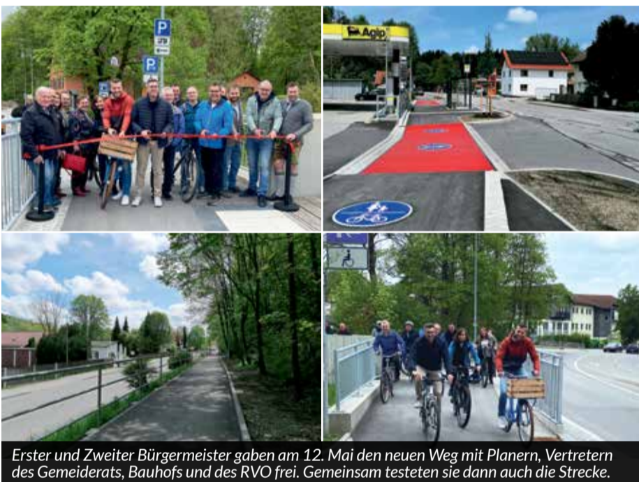
Erster und Zweiter Bürgermeister gaben am 12. Mai den neuen Weg mit Planern, Vertretern des Gemeinderats, Bauhofs und des RVO frei. Gemeinsam testeten sie dann auch die Strecke.

D ie Umbauarbeiten an unserer Ortsdurchfahrt im Bereich der Schongauer Straße sind abgeschlossen. Der neue kombinierte Geh- und Radweg konnte offiziell für die Nutzung freigegeben werden.