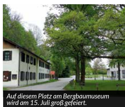
Auf diesem Platz am Bergbaumuseum wird am 15. Juli groß gefeiert.

A lle sind herzlichst eingeladen zum großen Sommerfest des Bergbaumuseums am Tiefstollen. Zur Musik der Knappschaftskapelle Peißenberg gibt es Kaffee und Kuchen sowie herzhaftes Brotzeiten vom Grill. Und wer möchte, kann bei einer Führung mit der Bahn in den Stollen fahren. Veranstalter sind die Bergbau-Museumsfreunde und der Knappenverein. Am Samstag, 15. Juli, Beginn um 14.00 Uhr. Wir freuen uns darauf! www.bergbaumuseum.peissenberg.de