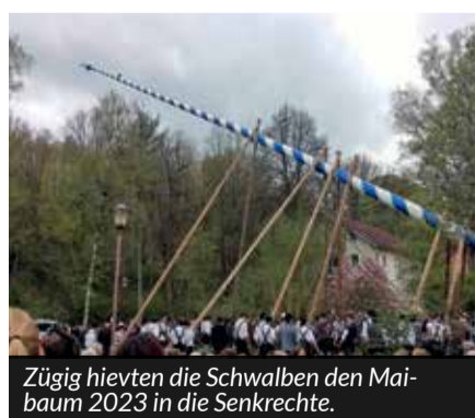
Zübig hievten die Schwalben den Maibaum 2023 in die Senkrechte.