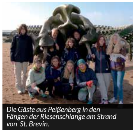
Die Gäste aus Peißenberg in den Fängen der Riesenschlange am Strand von St. Brevin.