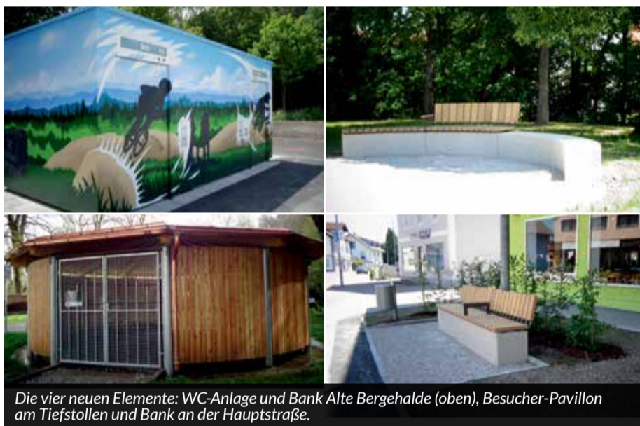
Die vier neuen Elemente: WC-Anlage und Bank Alte Bergehalde (oben), Besucher-Pavillon am Tiefstollen und Bank an der Hauptstraße.

Die Förderinitiative der Europäischen Union ,React-EU' wurde auch für unseren Ort genutzt. Sie dient zur Bewältigung von Aufgaben, die sich aus der Pandemie ergaben, durch sie gebremst wurden oder als Aufbauhilfe für den Zusammenhalt und die Gebiete Europas. Das Ziel besteht darin, Innenstädte durch verschiedene Maßnahmen für ein aktives Miteinander attraktiver zu gestalten.