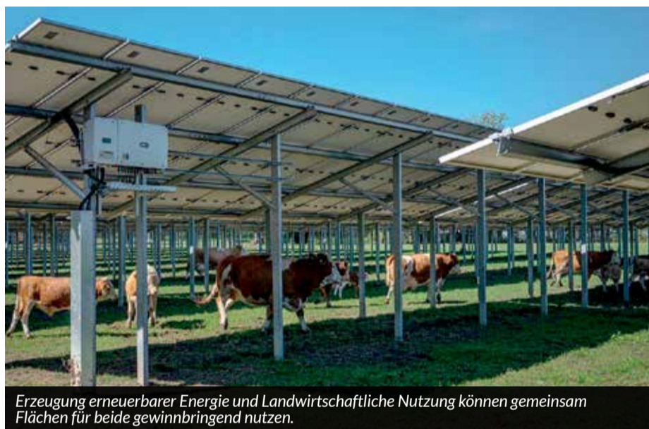
Erzeugung erneuerbarer Energie und Landwirtschaftliche Nutzung können gemeinsam Flächen für beide gewinnbringend nutzen.