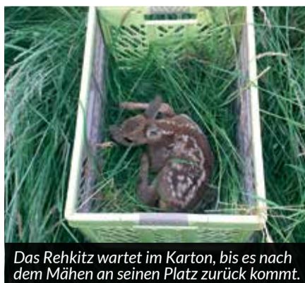
Das Rehkitz wartet im Karton, bis es nach dem Mähen an seinen Platz zurück kommt.