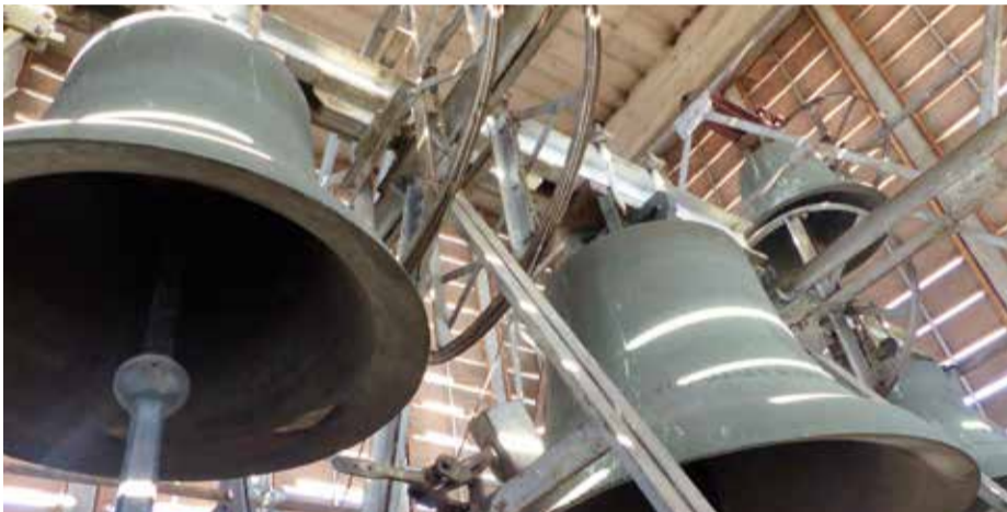
Die vier Glocken auf dem St.-Barbara-Kirchturm, rechts oben „St. Michael“, die kleinste.

M anch einer, der zugezogen ist oder nicht mit den Traditionen der evangelischen und katholischen Kirchen aufwuchs, fragt sich vielleicht, was es mit dem Glockengeläut auf sich hat.