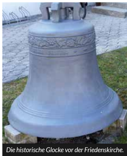
Die historische Glocke vor der Friedenskirche.

In der evangelischen Friedenskirche hängen drei Glocken. Es gibt keinen „Weckruf“, sagt Dr. Mogk. Läuten zum Mittag dauert fünf Minuten, ebenso zum Feierabend, um 18.00 Uhr (Sommer 19.00). Samstags hört man auch hier alle Glocken um 15.00 Uhr zur Vorbereitung auf den Sonntag, mit sieben Minuten das längste Geläut. Die historische Glocke mit der Inschrift „Jesus Christus ist unser Friede“ wurde 1999 vom Turm genommen, restauriert und steht nun vor der Kirche.