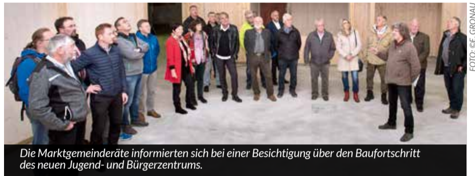
Die Marktgemeinderäte informierten sich bei einer Besichtigung über den Baufortschritt des neuen Jugend- und Bürgerzentrums.