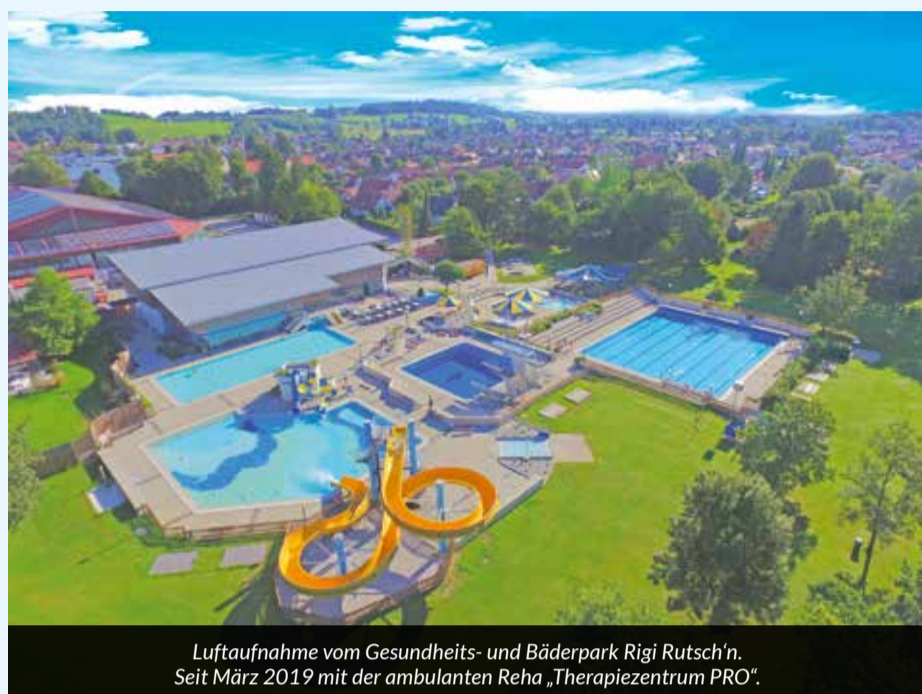
Luftaufnahme vom Gesundheits- und Bäderpark Rigi Rutsch'n. Seit März 2019 mit der ambulanten Reha „Therapiezentrum PRO“.

Sowohl die Saisonkarte für Erwachsene als auch die für Kinder/Jugendliche ist günstiger als im Vorjahr. Neu eingeführt wird eine „Kombi-Saisonkarte“, die eine flexiblere Gestaltung für Familien und Alleinerziehende ermöglicht und die alte „Familien-Saisonkarte“