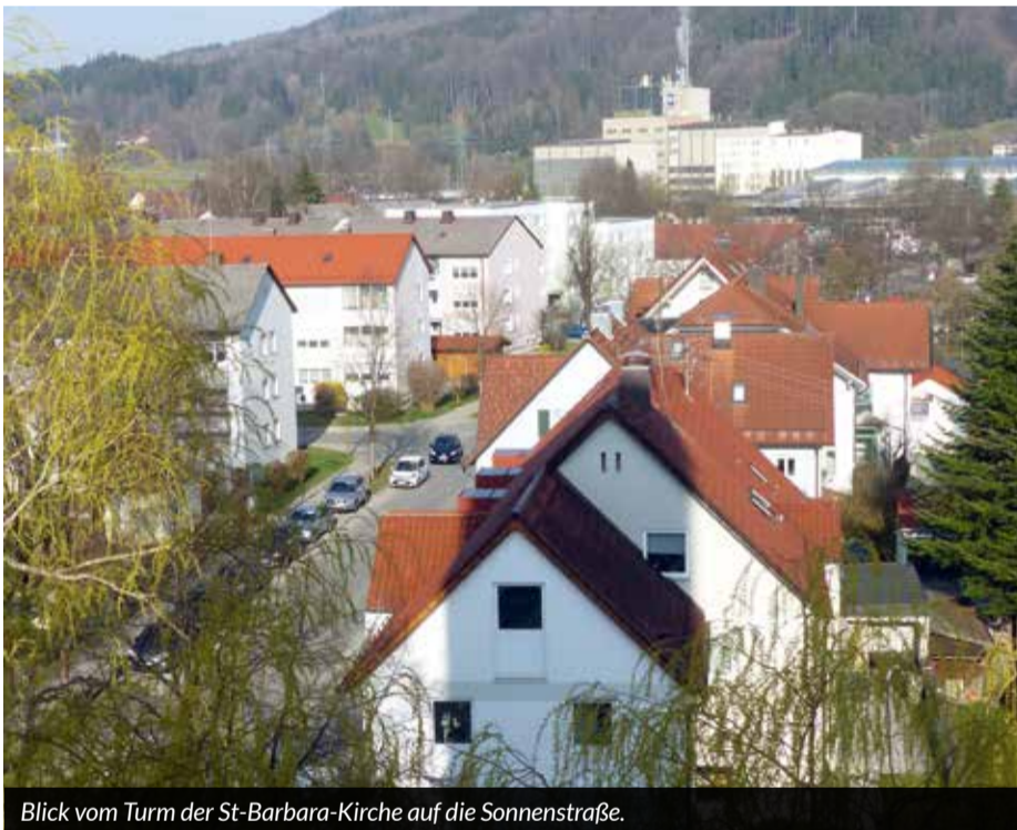
Blick vom Turm der St-Barbara-Kirche auf die Sonnenstraße.

DIESES MAL GESUCHT: WELCHES UNTERNEHMEN VEREINBART FAMILIE UND BERUF VORBILDHAFT?