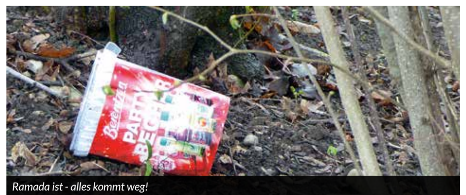
Ramada ist - alles kommt weg!